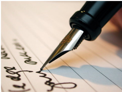
CV et lettre de motivation

Pour quels concours ces documents sont-ils exigés ?